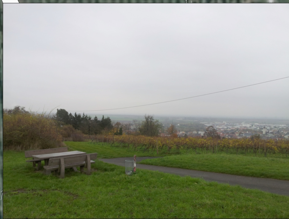
Blick vom FFH-Gebiet Richtung Osten (in der Mitte Robinien-Baumgruppe des Plangebietes erkennbar)

FFH-Gebiet "Kalkmagerrasen zwischen Ebertsheim und Grünstadt"